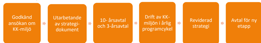
Bild 2 Programstruktur KK-miljöer

Under ramavtalet upprättas under programtiden olika etappavtal på 3-4 år (4 år för sista etappen). Dessa anger framförallt överenskomna mål för respektive etapp utifrån den plan lärosätet utarbetat. Etappavtalen ligger också till grund för uppföljning och utvärdering.