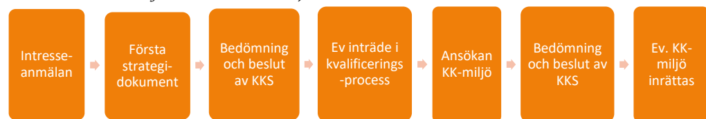
Bild 1 Processen för att bli KK-miljö

Ett viktigt moment i kvalificeringsprocessen är att lärosätet utvecklar och dokumenterar ett kvalitetssäkringssystem för verksamheten inom planerad KK-miljö. Systemet ska omfatta arbetssätt för strategiutveckling, förmåga till prioritering av insatsformer i förhållande till strategi, kvalitetssäkring av enskilda insatser samt uppföljning av insatser och av KK-miljöns utveckling i förhållande till strategi. Kvalitetssäkringssystemet prövas praktiskt genom att lärosätet tar fram och kvalitetssäkrar ett förslag till insats inom ramen för KK-stiftelsens programform Synergi.