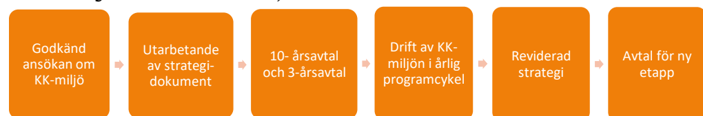
Bild 2 Programstruktur KK-miljöer

Under ramavtalet upprättas under programtiden olika etappavtal på 3-4 år (4 år för sista etappen). Dessa anger framförallt överenskomna mål för respektive etapp utifrån den plan lärosätet utarbetat. Etappavtalen ligger också till grund för uppföljning och utvärdering.