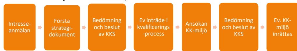
Bild 1 Processen för att bli KK-miljö

Ett viktigt moment i kvalificeringsprocessen är att lärosätet utvecklar och dokumenterar ett kvalitetssäkringssystem för verksamheten inom planerad KK-miljö. Systemet ska omfatta arbetssätt för strategiutveckling, förmåga till prioritering av insatsformer i förhållande till strategi, kvalitetssäkring av enskilda insatser samt uppföljning av insatser och av KK-miljöns utveckling i förhållande till strategi. Kvalitetssäkringssystemet prövas praktiskt genom att lärosätet tar fram och kvalitetssäkrar ett förslag till insats inom ramen för KK-stiftelsens programform Synergi.