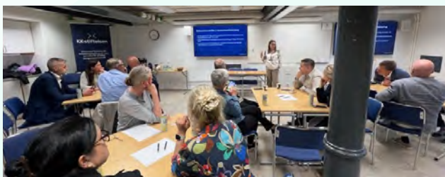
Workshop med tema Konkurrenskraft utan postnummer i Almedalen.

KK-stiftelsen driver frågan om breddad meritvärdering och utvecklade bedömningsprocesser, bland annat genom vårt engagemang i CoARA, där ökad samverkansmeritering är en central aspekt. Vi har under året varit aktiva i arbetsgruppen Improving practices in the assessment of research proposals och leder arbetet med riktlinjer för ansvarsfull bedömning. Under året har vi även inlett ett arbete med så kallade impact cases som synliggör exempel på hur samproduktion stärker forsknings- och utbildningsmiljöer och bidrar till näringslivets innovationsförmåga.