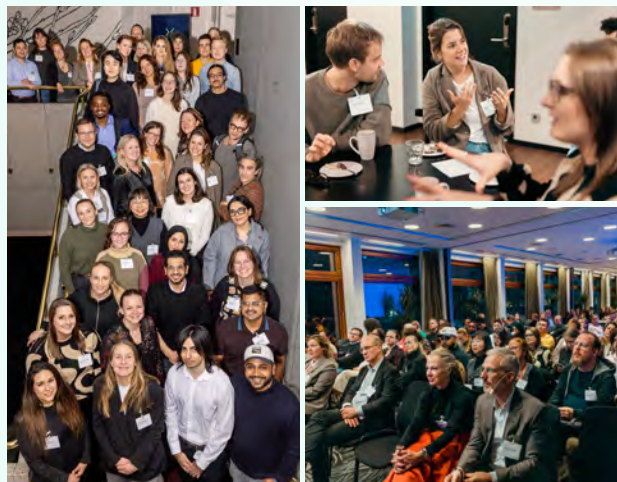
I november samlades KK-stiftelsens 44 jubileumsdoktorander och deras handledare för en första samverkansträff.

”Forskning inte är en isolerad strävan, utan ett kollektivt arbete för att bygga kunskap och lösa verkliga samhällsproblem”, säger han.