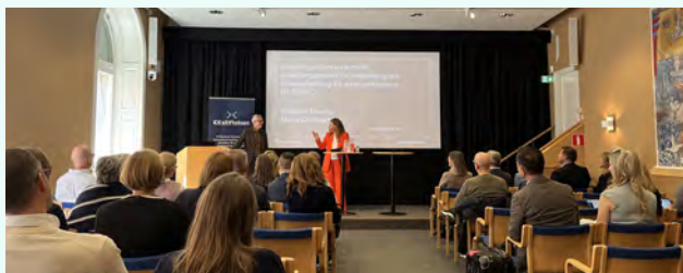
Seminarium om framtidens ersättningsmodell för vidareutbildning och omställning.